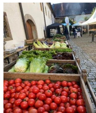
Foto: Gemüse aus Maria Bildhausen; Fotorechte: Landkreis Rhön-Grabfeld

Oder Sie scannen ganz einfach den QR-Code ab