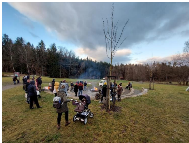
Foto: 1. Infoveranstaltung Waldkindergarten am 19.12.2021

Alle weiteren Informationen zu Kosten, Infoveranstaltung und den Aufnahmeantrag finden Sie unter www.nes-allianz.de