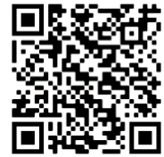
Bild: Postkarte und QR-Code zur Website

Im Landkreis Rhön-Grabfeld liegen die Postkarten „Sexismus ist out. Respekt ist in.“ Im Landratsamt und seinen Außenstellen aus; als Download stehen sie unter www.gleichstellung-unterfranken.de zur Verfügung.