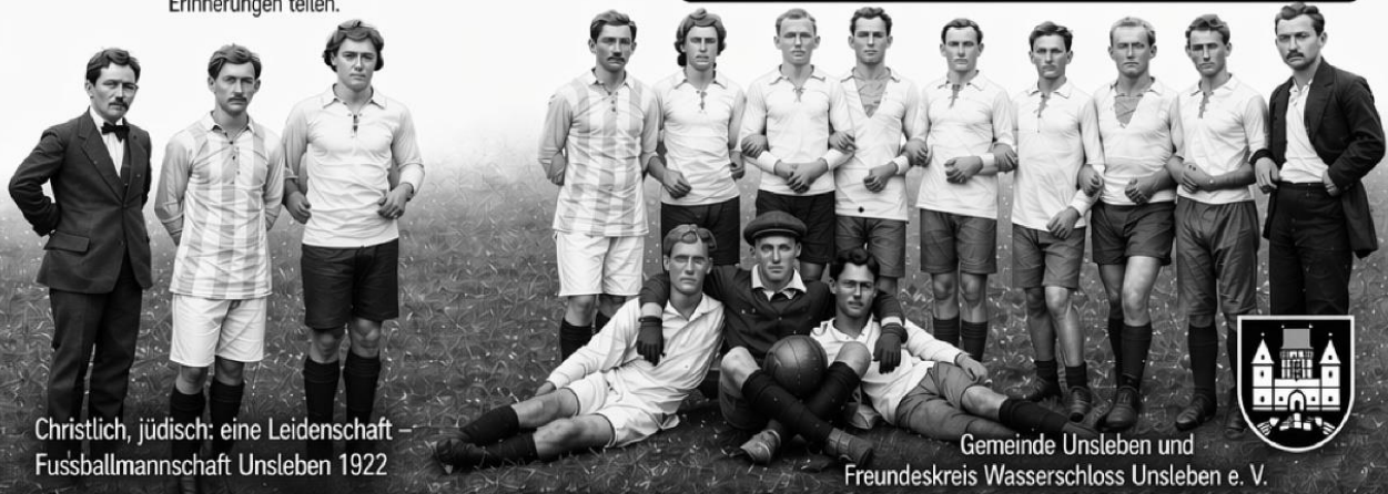
Christlich, jüdisch: eine Leidenschaft – Fußballmannschaft Unsleben 1922